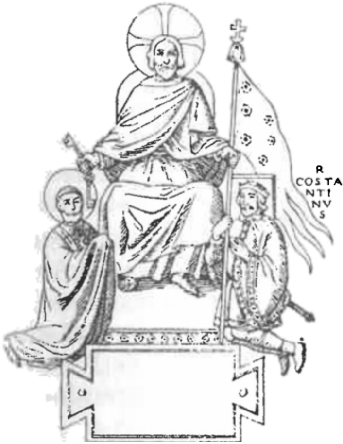
Le Christ remet les clefs au pape saint Sylvestre, et l'étendard surmonté de la croix à l'empereur Constantin. D'après une mosaïque du IV e siècle à Saint Jean de Latran, à Rome.