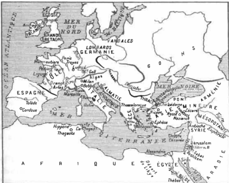
L'Église sous l'Empire Chrétien