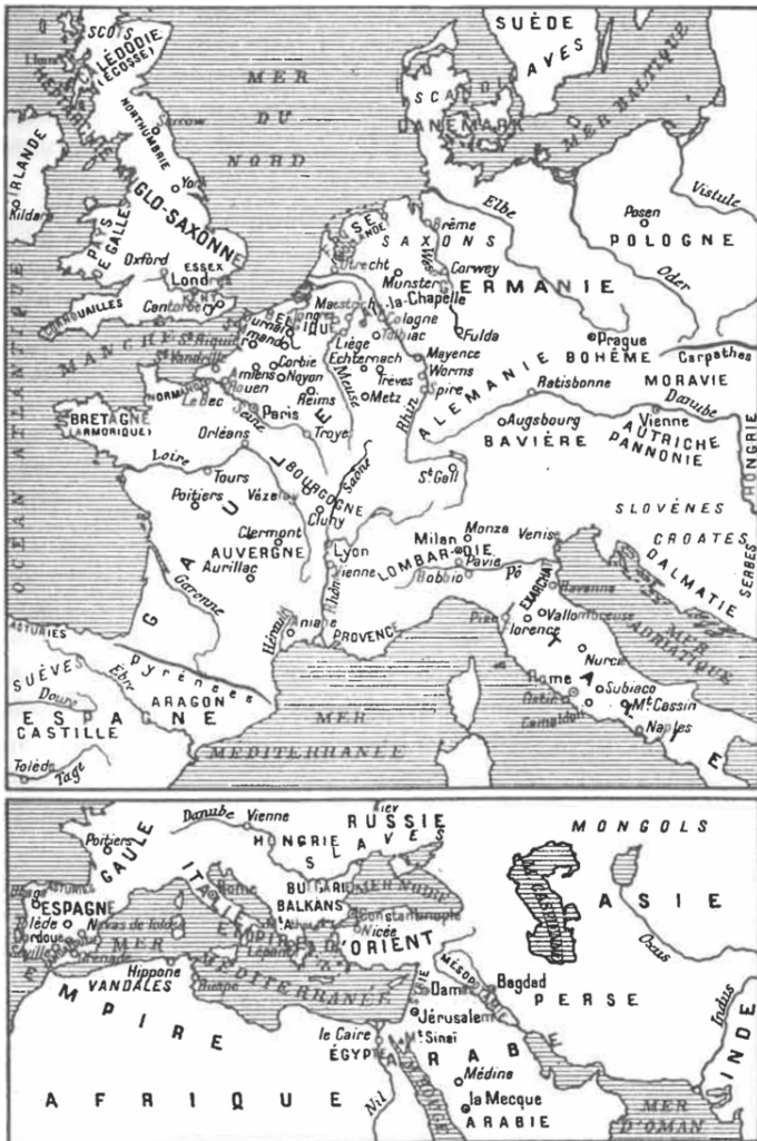
L'Église durant le haut Moyen-Âge